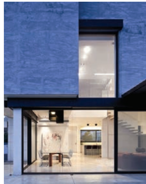
מגורים DWELLINGS 85