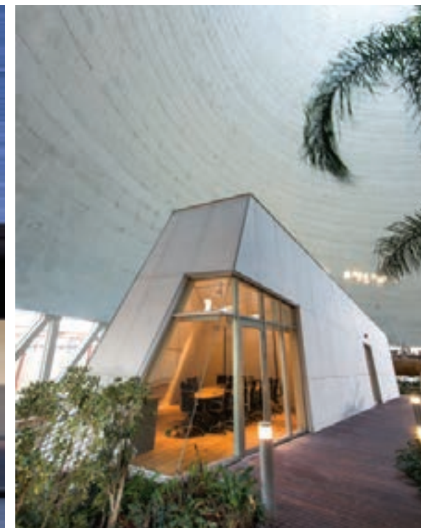
טופ 14 TOP 7